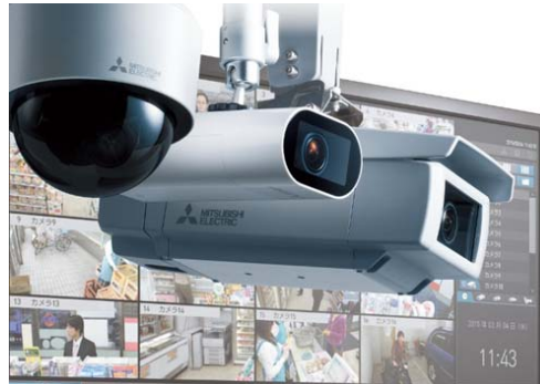
三菱電機 ネットワークカメラ