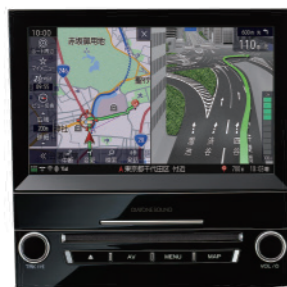
IMPREZA SUBARU XV専用 8インチビルトインモデル H0014FL030GG

SR-G400はどのナビでも 高音質を楽しめますが、 DIATONE SOUND.NAVI との組み合わせで 最も能力を発揮します!