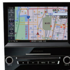
FORESTER専用 8インチビルトインモデル H0014SJ020SS

SR-G400はどのナビでも 高音質を楽しめますが、 DIATONE SOUND.NAVI との組み合わせで 最も能力を発揮します!