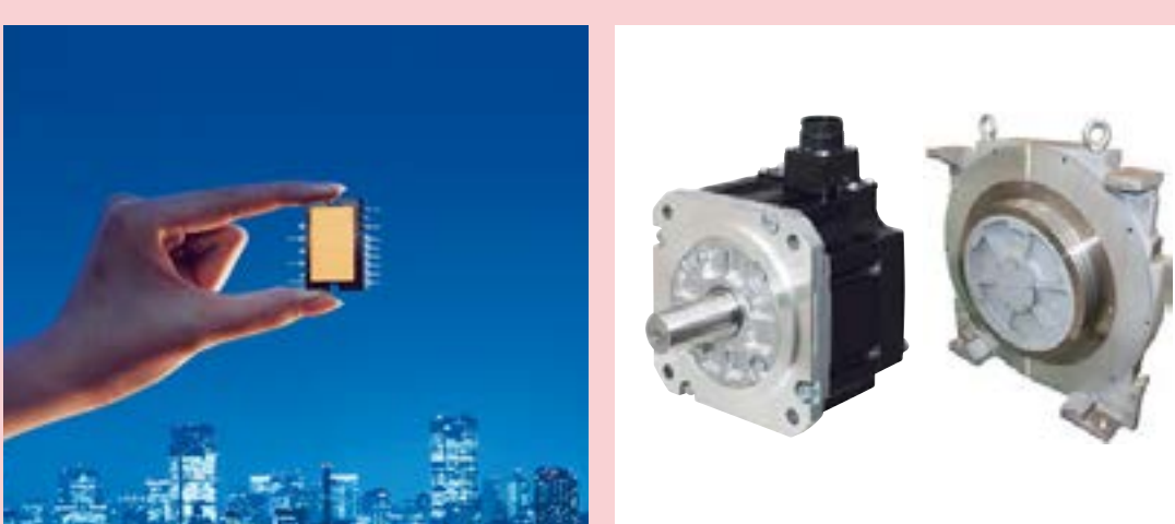
パワーエレクトロニクス