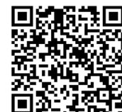
申込み二次元コード

【お申込みに関する連絡事項】 申込み受付は先着順とし、定員になり次第締め切らせていただきますので、あらかじめご了承ください。