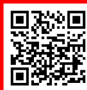
ツアー場所 (Googleマップ)

・サービスで培ったノウハウと技術を生かし、再生したリニューアル機械の見学会を実施いたします！