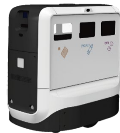
自律走行ごみ箱ロボット