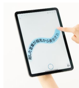
しゃべり描き®アプリの使用イメージ